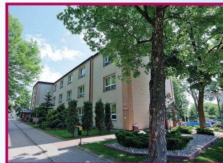
Internat Zespołu Szkół w Staszowie.

Nowoczesna edukacja dla Twojej przyszłości