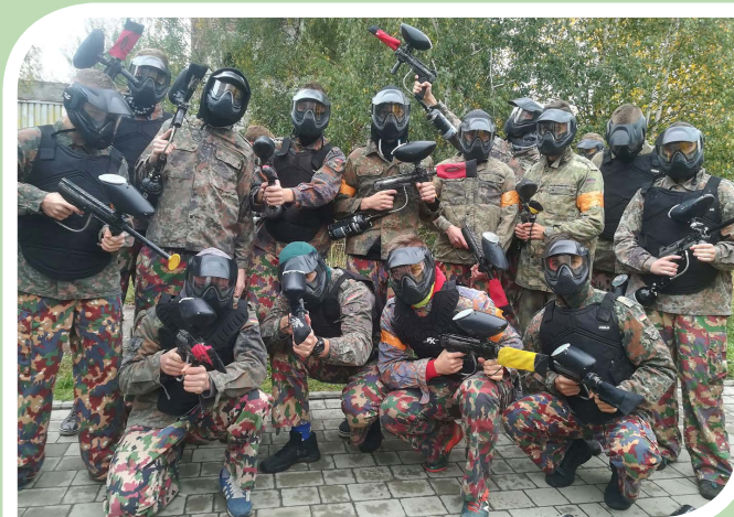
Wyjazdy, wycieczki, rajdy górskie, rajdy rowerowe – tak integrujemy się po lekcjach