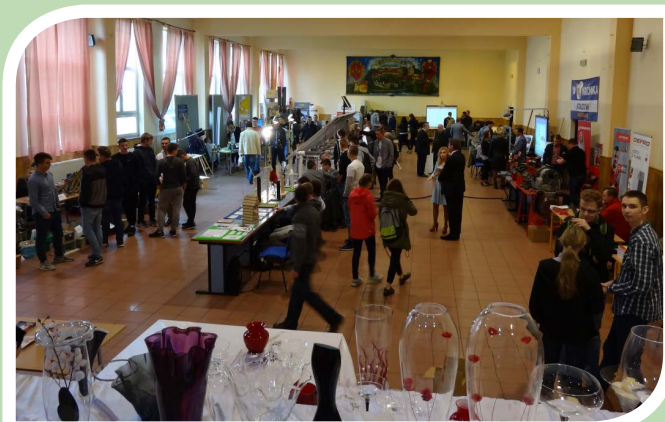
Dni Techniki – coroczna impreza organizowana od 2014 roku