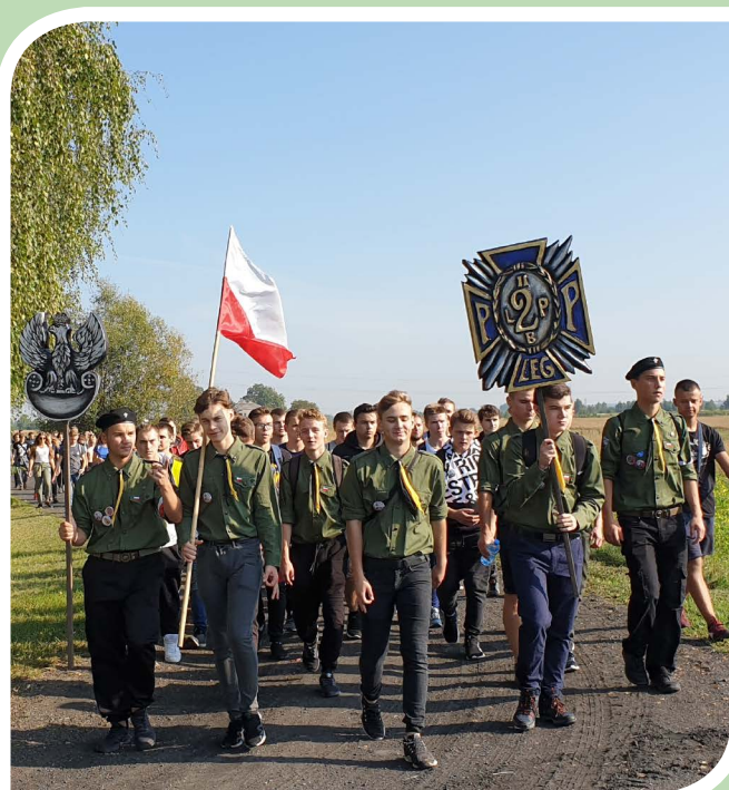
Drużyna Harcerska im. Ludwika Machalskiego „Mnich” dba o wartości duchowe i sprawność fizyczną