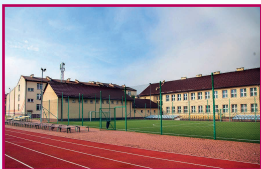
Zespół Szkół im. Oddziału Partyzanckiego AK „Jędrusie” w Połańcu.

Pomagamy wybrać szkołę • Serdecznie zapraszamy