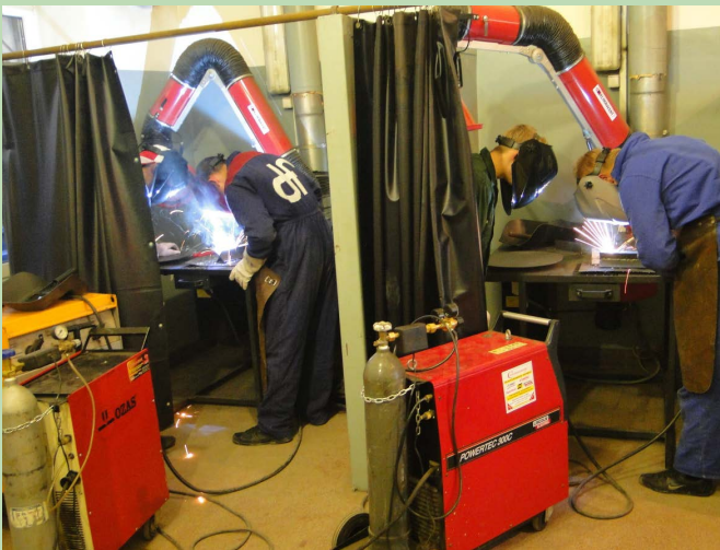
W trakcie zajęć praktycznych