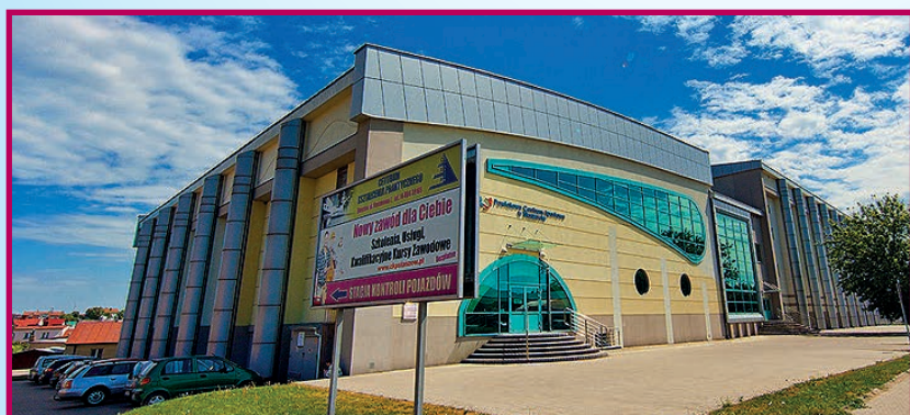
Powiatowe Centrum Sportowe w Staszowie.

Nowoczesna edukacja dla Twojej przyszłości