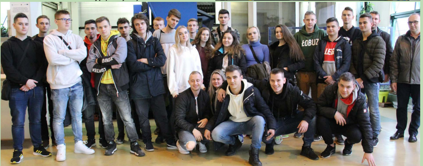
Wyjazd na Politechnikę Świętokrzyską w ramach akcji "Polibus-nauka na kołach"