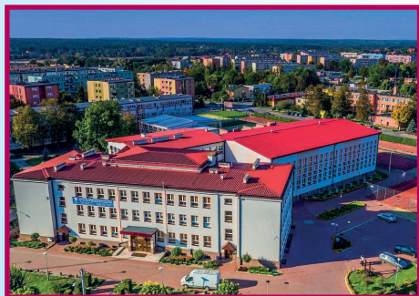
Liceum Ogólnokształcące im. ks. kard. Stefana Wyszyńskiego w Staszowie.