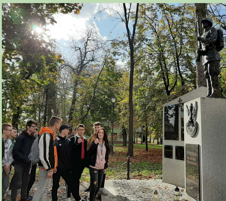
U nas lekcje odbywają się nie tylko w salach szkolnych. Na zdjęciu młodzież podczas plenerowej lekcji historii