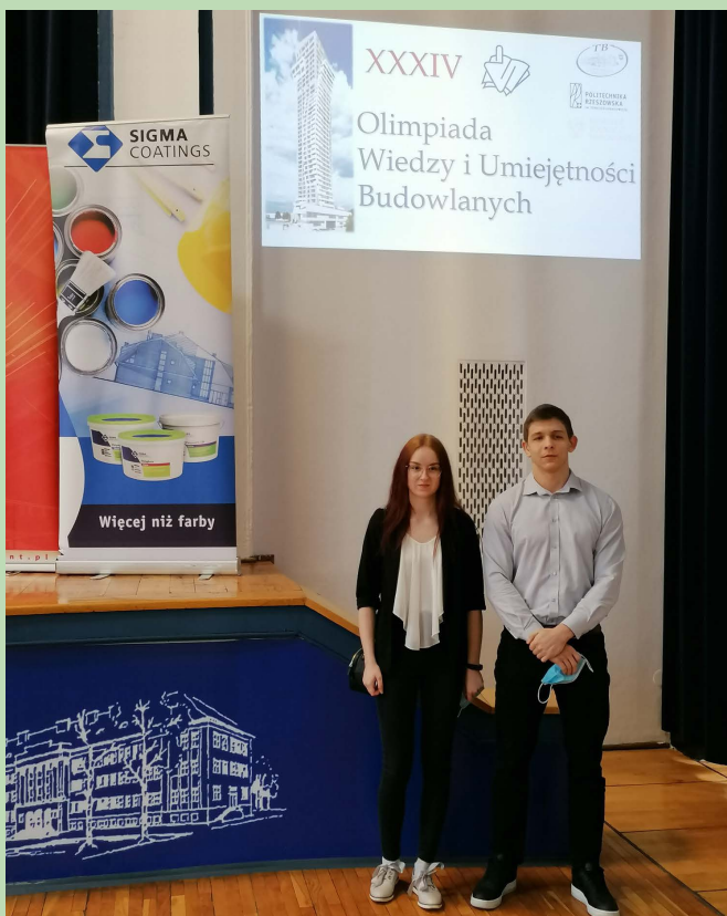
Olimpiada Wiedzy i Umiejętności Budowlanych – Rzeszów 2021