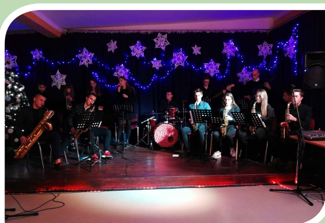
STASZICÓWKA_BAND – od lat uświetnia wydarzenia szkolne, powiatowe, wojewódzkie...