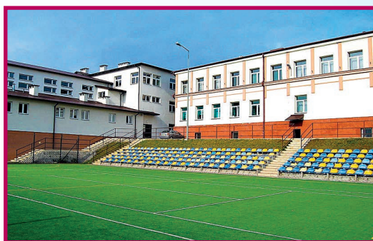
Zespół Szkół Ekonomicznych im. Jana Pawła II w Staszowie.