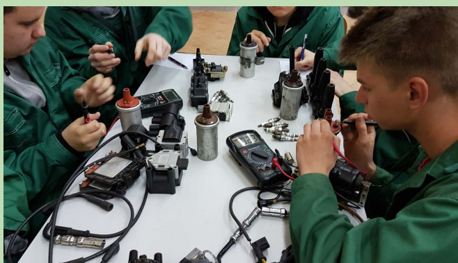
Zajęcia praktyczne to nieodzowny element uzyskania dobrego przygotowania zawodowego.