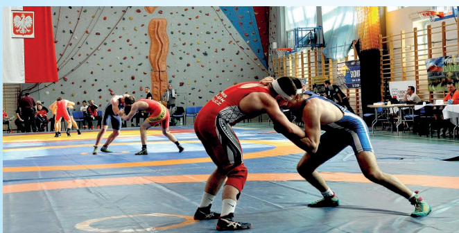
W ciągu całego roku organizowane są zawody sportowe, również rangi ogólnopolskiej. Z tyłu widoczna ścianka wspinaczkowa.