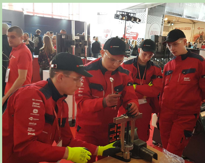
Mistrzostwa mechaników w Poznaniu