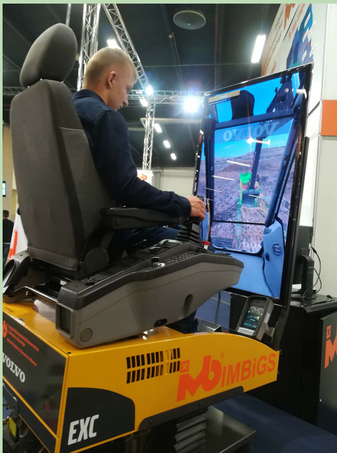
Podczas wyjazdów uczniowie mogą osobiście zobaczyć wszelkie nowinki techniczne