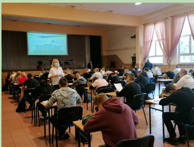
Szkolenie BHP dla budowlanców