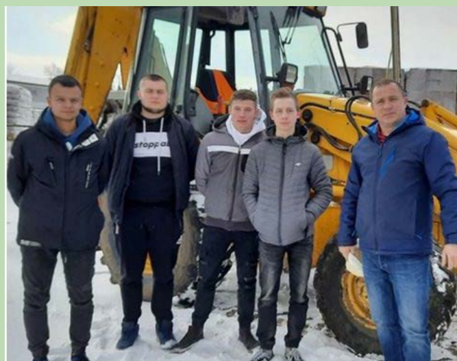
Kurs obsługi koparko – ładowarki w ramach projektu „Kompleksowy rozwój Zespołu Szkół”