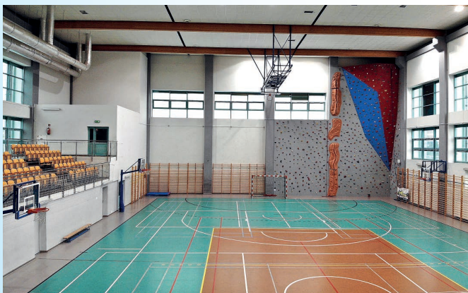
Główne boisko hali sportowej o wymiarach 20 x 40 m.

Przy PCS na podstawie umowy o współpracy działa także Stowarzyszenie „Centrum” Sport i Rekreacja, które realizuje szereg działań sportowo – rekreacyjnych, projektów z pozyskanych środków zewnętrznych skierowanych głównie do mieszkańców Powiatu Staszowskiego. Klub prowadzi dwie sekcje sportowe: pływacką i zapaśniczą.