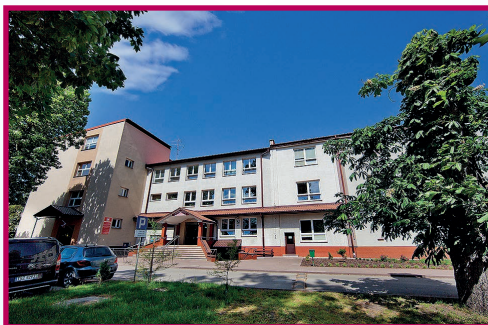
Zespół Szkół im. Stanisława Staszica w Staszowie.