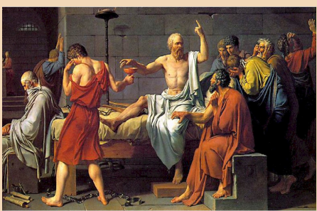
Los Sofistas y Sócrates

4ª. Para Sócrates la dialéctica (mayéutica) es el camino para sacar a la luz la verdad interior, mientras que para los Sofistas el lenguaje no ayuda a esclarecer la verdad, sino que es el arte de la seducción al margen de la verdad y de la justicia de los discursos.