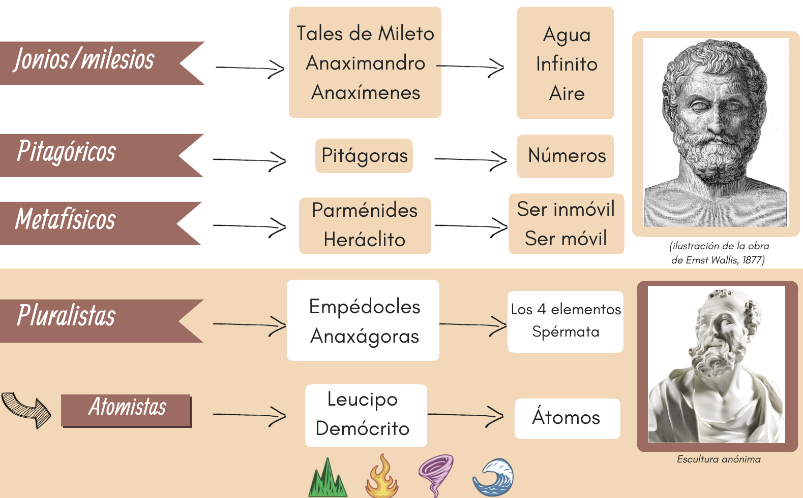
(ilustración de la obra de Ernst Wallis, 1877)

Estos se dividen en distintas etapas, donde cada uno realizó su propia búsqueda del arjé.