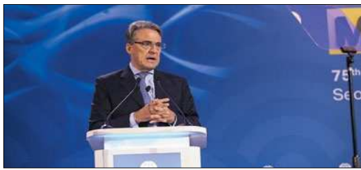
El director general y CEO de IATA, Alexandre de Juniac.

La Asociación Internacional del Transporte Aéreo (IATA) cumple su amenaza, haciendo nuevamente caso omiso a las peticiones del Sector. Como avanzó en exclusiva NEXOTUR, a partir del próximo 1 de enero se elimina la opción de liquidar mensualmente al BSP. Además de en España, esta polémica medida se implementará en todos los países donde todavía existía esta frecuencia de pago: Botsuana, Grecia, Israel, Italia, Malta, Marruecos, Sudáfrica y Túnez.