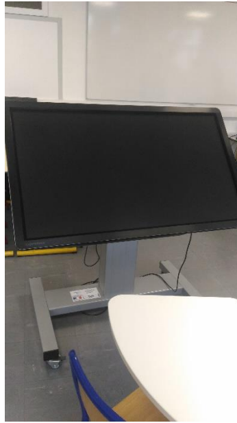
Prêt d'une table interactive par le DANE.