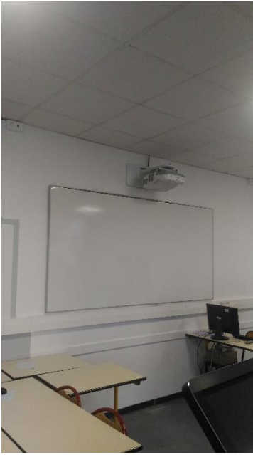
Installation d'un VPI en face des fenêtres.